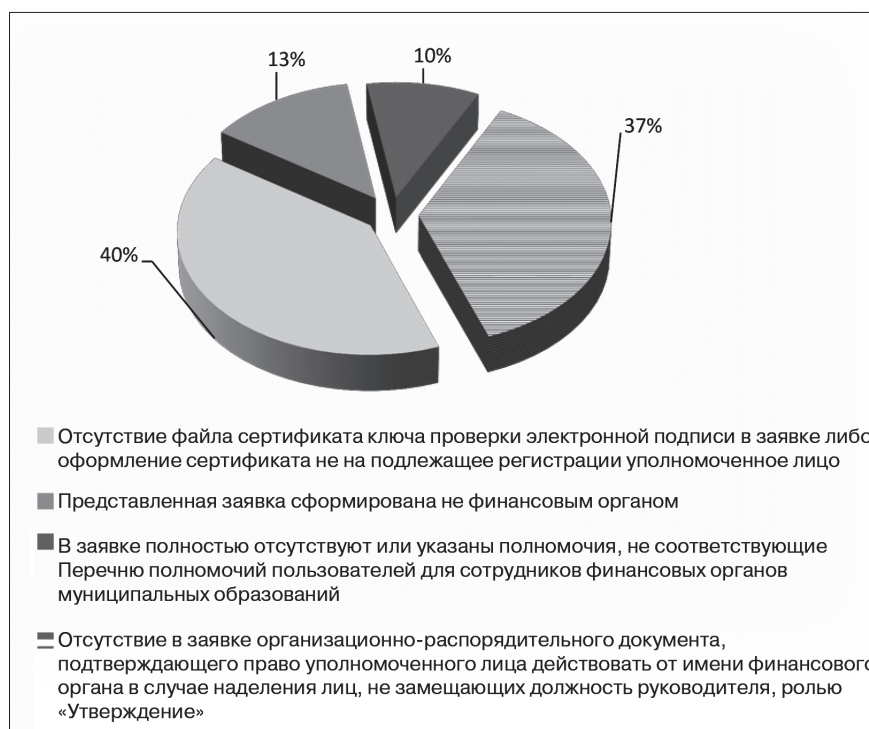
Рис. 1. Структура отказов в приеме заявок на регистрацию уполномоченных лиц муниципальных финансовых органов в разрезе причин

В Управлении Федерального казначейства по Омской области (далее – УФК по Омской области, Управление) за период с 1 октября 2019 г. по 1 октября 2020 г. обработано 695 заявок на регистрацию (изменение сведений) уполномоченных лиц муниципальных финансовых органов, из них принято положительное решение по 640 заявкам, возвращено без исполнения – 55 заявок. Структура отказов в разрезе причин приведена на рис. 1.